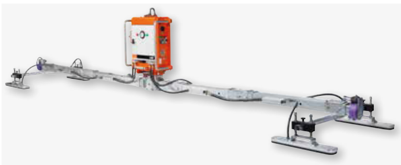
Ausführung für Dachpaneelen

VAKUUMHEBEGERÄT FÜR DACH- UND WANDPANEELN